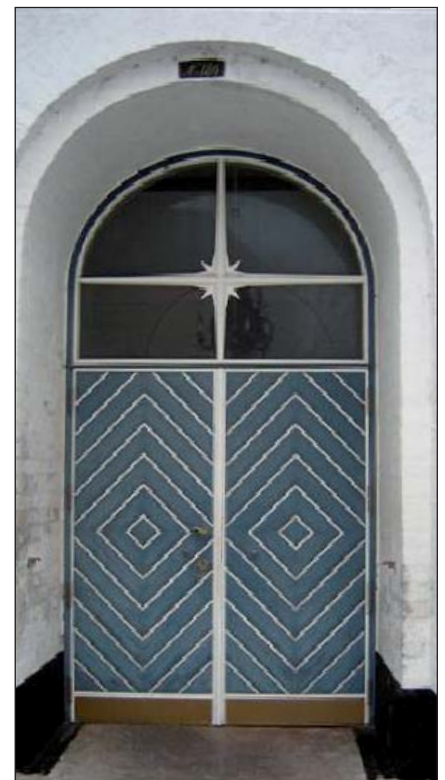
Kirkedør i Ærøskøbing Kirke.