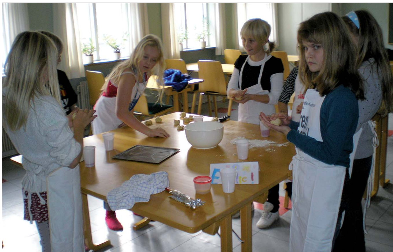
Denne tirsdag var temaet for minikonfirmanderne: Nadveren. Vi indledte derfor eftermiddagen med at bage brød og presse druesaft. Herefter holdt vi nadver i Marstal Kirke med hjemmelavet brød og vin/druesaft.

Billetterne sælges ved indgangen og kan ikke forudbestilles.