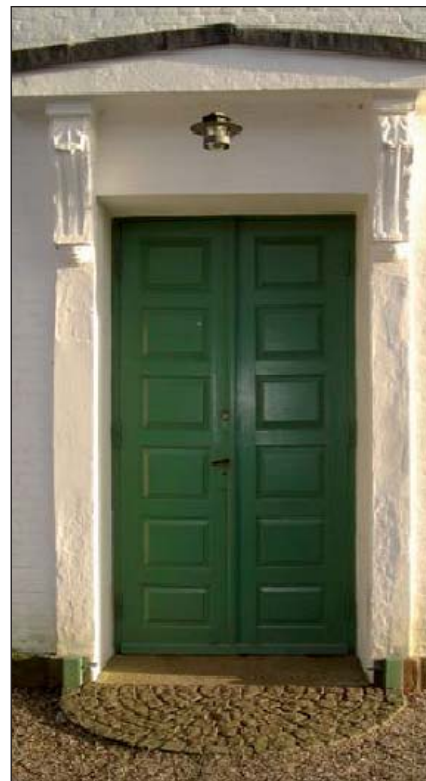
Kirkedør i Tranderup Kirke.

Det vigtigste argument for at opgave skriftemålet i altergangen er, at det udgør en fordobling af nadveren. For selve nadveren cen-