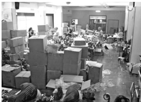
Sortering af julepynt til julebasaren.

Det er en kæmpe begivenhed at skulle stable på benene, og fuldstændig uladsgørlig uden hjælp. Alt fra pensionister til studerende river en weekend ud af kalenderen for at støtte kirken, og vi er evigt taknemmelige. Især de unges engagement i kirken er enestående i forhold til hvad vi kender hjemme fra Danmark, og det er en fornøjelse at være en del af en så levende og alsidig kirke.