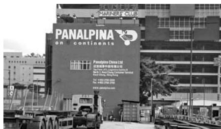
Vi bor i bygningen »Panalpina«.

I juli blev vi sendt til Hong Kong for at arbejde som assistenter for den danske sømandskirke. Et par af vores venner har været ansat ved kirken for to år siden, og vi følte os derfor temmelig godt forberedte på de opgaver vi måtte blive stillet overfor i løbet af vores år i Hong Kong. Selvfølgelig var vi klar over at de søfarende på de danske skibe ville blive en stor del af vores hverdag, og vi har haft rigtig mange hyggelige stunder her på vores arbejdsplads, som også er vores hjem, på havnen.