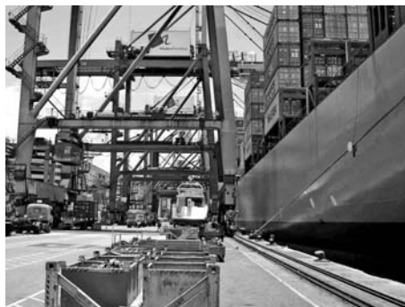
Skibsbesøg på havnen.

regel altid en rigtig god snak med de søfarende, og det kan sommetider være svært at forstå at det er en del af vores arbejde og ikke fritid. Og det er nok det der i høj grad kendetegner vores liv her i Hong Kong. Igennem vores arbejde herude har vi mødt en masse imødekommende mennesker, som vi efterhånden også ser i mindre arbejdsrelaterede situationer.