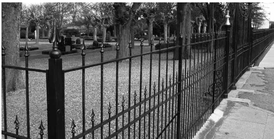
Reparation af kirkegårdsgitteret fra 1896 har hørt til blandt udgifterne i 2005.